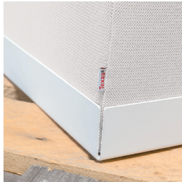
Fuß aus weißlackiertem Stahl