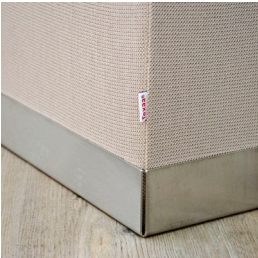
Fuß aus gebürstetem Edelstahl