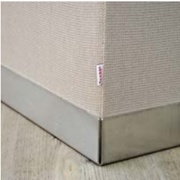
Fuß aus gebürstetem Edelstahl