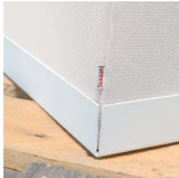
Fuß aus weißlackiertem Stahl